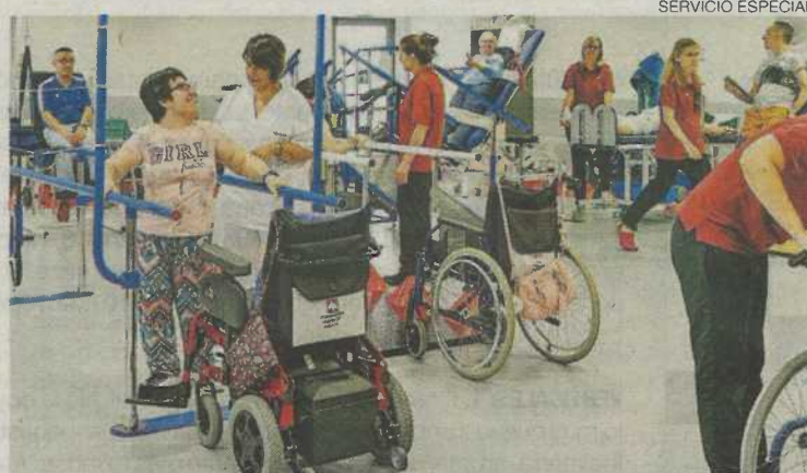
►► Sesión de rehabilitación en un gimnasio de DFA.

Se trata de una intervención integral e interdisciplinar, «ya que es imposible atender necesidades de un área sin influir en el resto», por lo que se trabaja de manera conjunta entre los Centros de apoyo social y de rehabilitación. De esta manera, se ofrece una atención individuali-